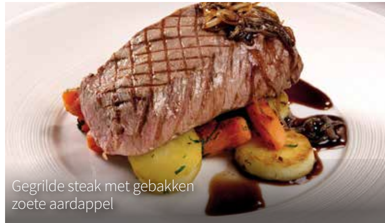
Gegrilde steak met gebakken zoete aardappel