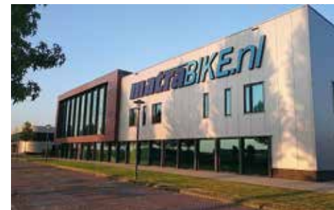
Matrabike Experience Center Waalwijk (NL)

Antwerpsestraat 83, 2840 Reet (gemeente Rumst), België. Tel. +32 38880990